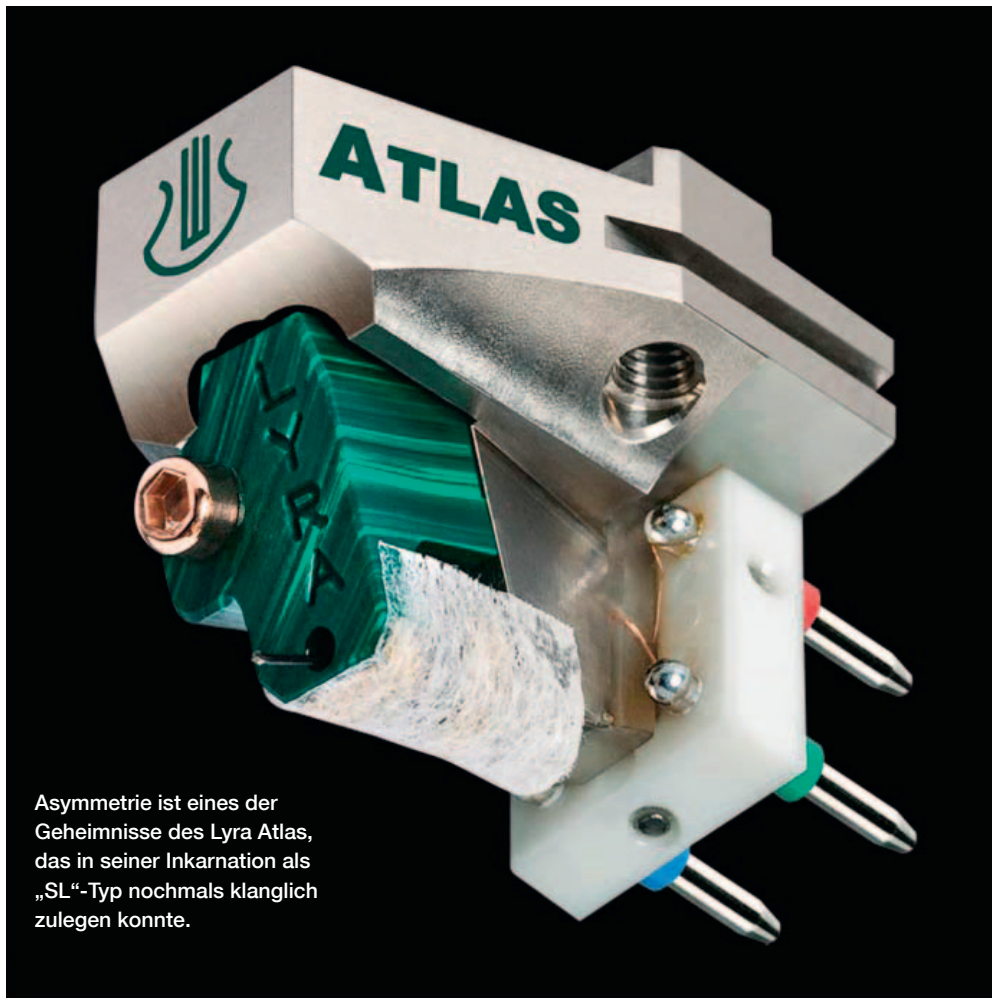
Asymmetrie ist eines der Geheimnisse des Lyra Atlas, das in seiner Inkarnation als „SL“-Typ nochmals klanglich zulegen konnte.

Niemand kann sagen, Jonathan Carr wäre nicht mutig. Wäre er es nicht, hätte er sich niemals getraut, einem ohnehin superleisen MC-System nochmals eine Lage Spulenwindungen zu entwenden, um ein Meisterstück zu schaffen.