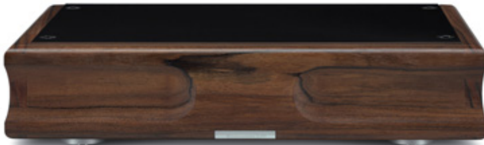
Die Audioschaltungen sitzen unter einem Kunststoffdeckel in einem vorbildlich verarbeiteten Holzrahmen