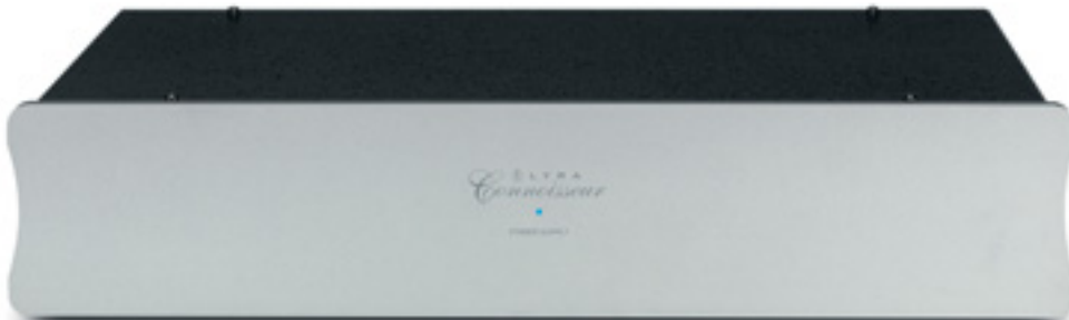
Ein äußerst solides Metallgehäuse umgibt das satt dimensionierte Netzteil