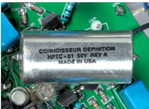
Die silbernen Kondensatoren in der Ein- und Ausgangsstufe (oben) gehören zum Feinsten, was zu bekommen ist